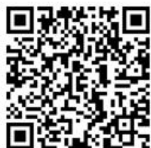
(株)ファーストライン二日市店