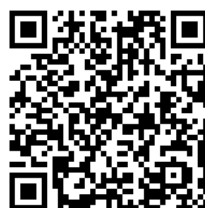
(株)ファーストライン天神店